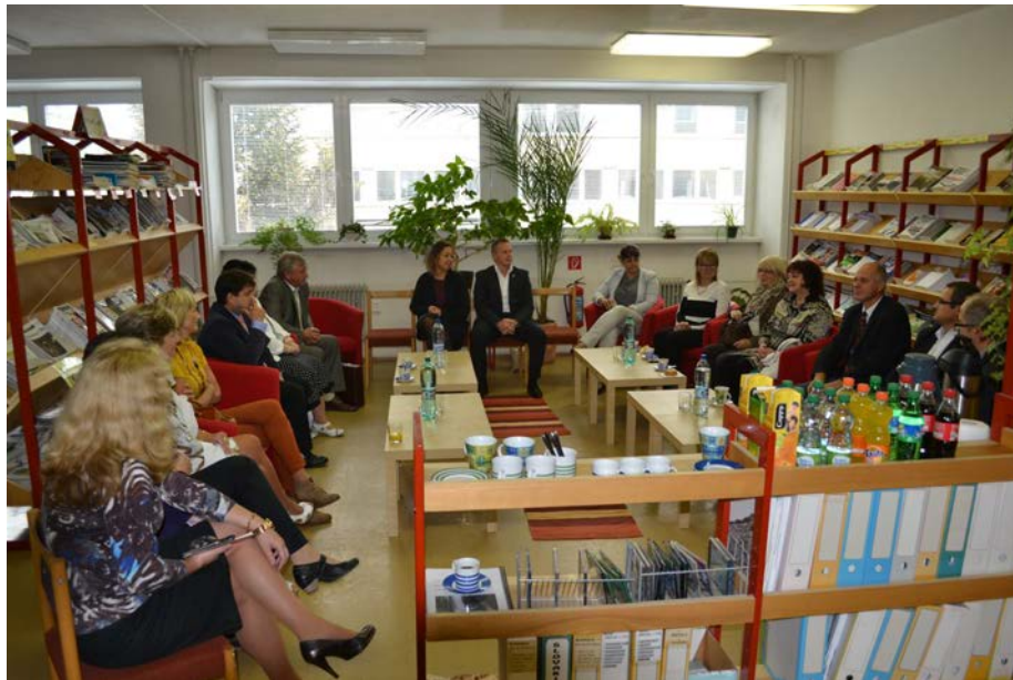
Akcia „ranná káva s riaditeľmi stredných škôl“ v Trenčíne

18. septembra 2013 sa na Vysokej škole manažmentu v Trenčíne uskutočnilo stretnutie „Ranná káva s riaditeľmi SŠ“, na ktorú boli pozvaní riaditelia stredných škôl trenčianskeho regiónu. Stretnutie sa zúčastnilo 11 riaditeľov SŠ a spolu s predstaviteľmi VŠM prediskutovali hlavné činnosti VŠM ako aj možnosti využívania knižnice VŠM či ďalšej spolupráce medzi strednými školami a VŠM na podporu kvality vzdelávania študentov stredných škôl.