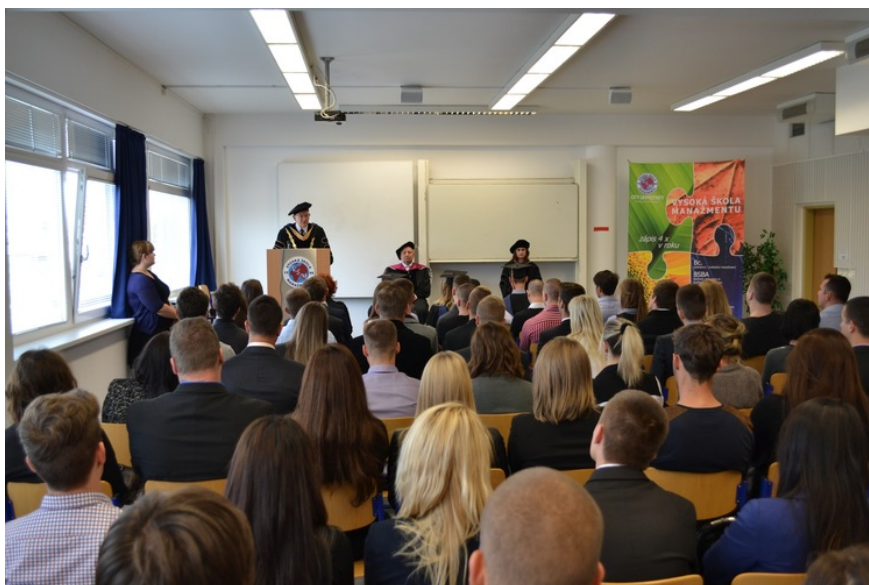
slávnostná imatrikulácia študentov v Bratislave

V pondelok, 30.9.2013, sa na pôde Vysokej školy manažmentu v Bratislave za účasti akademických funkcionárov Vysokej školy manažmentu a City University of Seattle uskutočnila imatrikulácia spojená so slávnostným otvorením školského roka 2013/2014. Počas tejto slávnostnej ceremónie študenti prvých ročníkov zložili imatrikulačný sľub a začlenili sa tak do širokej študentskej obce so všetkými právami a povinnosťami s tým súvisiacimi.