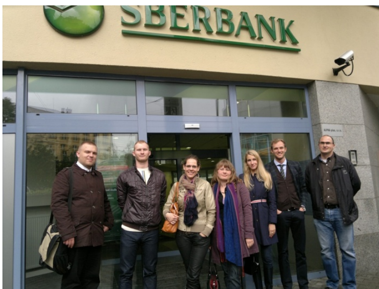
študenti a vyučujúci VŠM / CityU počas návštevy Sberbank