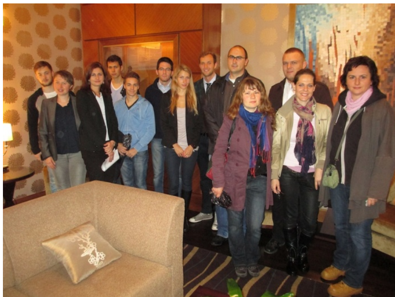
študenti a vyučujúci VŠM / CityU počas návštevy Sberbank