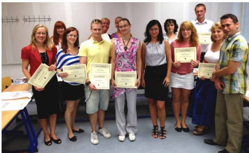
účastníci letných online kurzov so svojimi vyučujúcimi počas preberania certifikátov