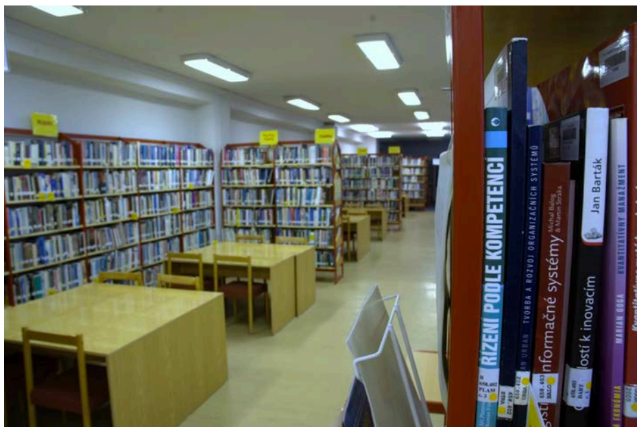
knižnica Vysokej školy manažmentu v Trenčíne