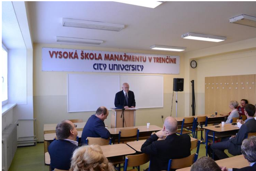
otvorenie akademického roka v Trenčíne

Po úvodnom zasadnutí a obedovej prestávke nasledovali jednotlivé stretnutia katedier, kde si učitelia nielen vymenili svoje skúsenosti, ale tiež prebrali postupy a učebné metodológie pre ďalší akademický rok ako aj úlohy, vyplývajúce z prípravy komplexnej akreditácie. Posledným bodom programu bolo zasadnutie Akademického senátu, na ktorom sa zúčastnil aj rektor VŠM. Slávnostnou večerou sa táto prospešná a úspešná akcia ukončila.